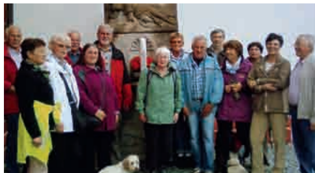
Leider war die Marienkirche geschlossen. Die Pilgerung endete vor der Kirche.

Nach einem kräftigen „Pilgermahl“ - Essen und Trinken halten bekanntlich Leib und Seele zusammen - ging es zuerst auf ebener Strecke zur Erpeler Ley. Von dort genossen alle den herrlichen Blick auf das Rheintal, die Hocheifel und das Siebengebirge. Nach einem rasanten Abstieg führte der Weg den Rhein entlang zurück nach Unkel - und das inzwischen bei bestem Wanderwetter. Den Blumenkorso in Erpel anlässlich des Weinfestes empfand man als