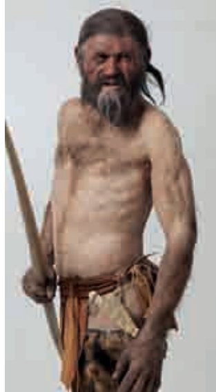
Rekonstruktion des Ötzi von Kenis.

Niels Lynnerup, Präsident des wissenschaftlichen Fachbeirats vom Mann aus dem Eis, hielt den Festvortrag zum Thema: „Warum den Eismann erforschen?“ Lynnerup sagte, dass dieser Fund so außergewöhnlich war und, dass er deshalb untersucht werden musste. Er ergänzte: „Wir werden nie die ganze Wahrheit über unsere Vergangenheit erfahren, durch Funde wie Ötzi können wir Ge-