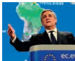
Antonio Tajani (2011)

Tajani ist als EU-Kommissar in Brüssel vorwiegend für den Bereich Wirtschaft zuständig. Zusammen mit Landeshauptmann Luis Durnwalder hat Tajani bei seinem Besuch in Bozen eine lange Liste an Themen abgehandelt: vor allem mit Lob bedachte der EU-Kommissar Südtirols Wirtschaft, welche auf soliden Beinen in Form von kleinen und mittleren Unternehmen, von Handwerk, Industrie und Tourismus steht. Er sagte zudem: „Europa muss wieder verstärkt auf die Realwirtschaft setzen.“ Wenn Südtirol auch auf weit entfernten Märkten aktiv werden möchte, müsse in China oder Russland etwa ein ge-