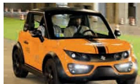
Im Test-Areal konnte die Mobilität der Zukunft hautnah erlebt werden.

Der Großteil der rund 8000 Besucher stammte aus Venetien,