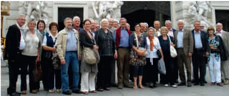
Führung durch die österreichische Hauptstadt Wien mit Vertretern des Tirolerbundes.

Verein hat der Tirolerbund Wien eine besondere Position. Diese grenzüberschreitende Gesinnung verlieh der Tagung eine besondere Atmosphäre, die durch das internationale Flair des Tagungsortes Wien (Standort der UNO-City) noch unterstrichen wurde.