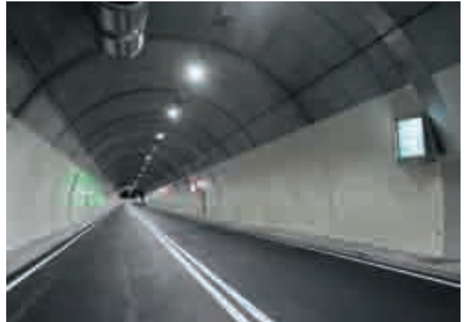
Blick in den Tunnel - 16.4.2011