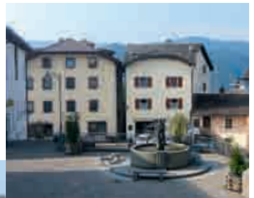
Dorfbrunnen von Deutschnofen.

Der Ursprung des Wallfahrtsortes Maria Weißenstein liegt im Jahre 1553, als die