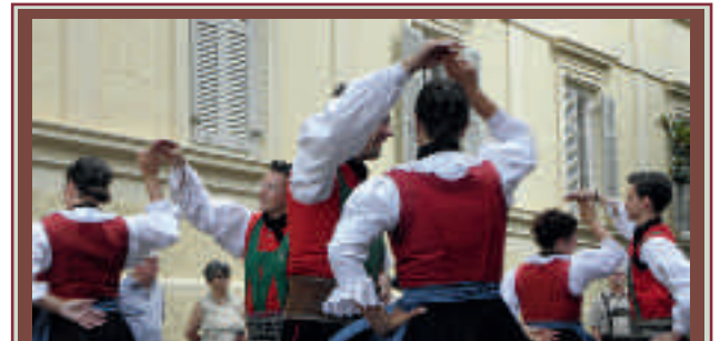
Südtiroler Brauchtum - erfahren, mitmachen, (er)leben 11. - 13. November 2011 im Schloss Goldrain (Vinschgau)

Anmeldung bei: Südtiroler in der Welt – Arbeitsstelle für Heimatferne, Tel. 0471 300213; Fax 0471 982867; suedtiroler-welt@kvw.org