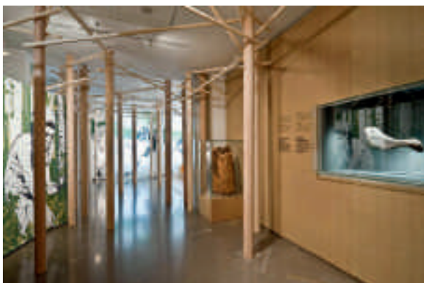
Links: auf vier Etagen erstreckt sich die Sonderausstellung „Ötzi20“.

Neben der Sonderausstellung plant das Mu-