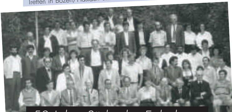
Treffen in Bozen/Haslach am 26.9.1987