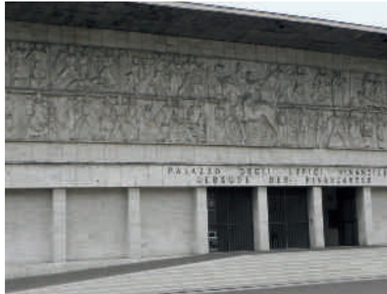
Das Mussolini-Relief am Bozner Finanzgebäude erregt die Gemüter.

Laut Beschluss der Landesregierung sollten bei den umstrittenen Beinhäusern aus der Zeit des Faschismus in Burgeis, Innichen und Gossensaß erklärende Tafeln angebracht werden. Alle Besucher der Beinhäuser sollten künftig darüber unterrichtet werden, weshalb von 1937 bis 1939 in der Nähe der wichtigsten Grenzübergänge des Landes drei Ossarien errichtet worden sind. <