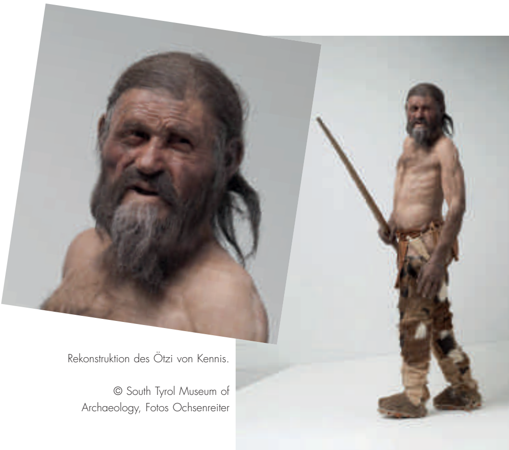
Rekonstruktion des Ötzi von Kennis.