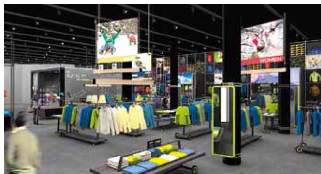
Die neue Salewaworld

Charakteristisch für das gesamte Bauwerk ist die neue „Salewa World“. Dieser Verkaufspunkt ist für alle Endkonsum-