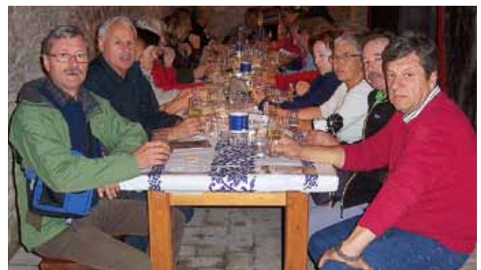
Die gute Küche der Emilia Romagna wurde allgemein gelobt.

lia Romagna vieles zu bieten. Die Teilnehmer hatten Gelegenheit, vor Ort die Herstellung des luftgetrockneten Parmaschinkens, des schmackhaften „Parmeggiano Reggiano“ und des weltbekannten „Balsamico di Modena“ mit zu verfolgen und zu verkosten. Dasselbe gilt für die auserlesenen Weine der Gegend, wie den schäumenden „Lambrusco“. Ein besonderes Vergnügen war es jedesmal, sich zu den Mahlzeiten an den Tisch zu setzen und in aller Ruhe die köstlichen selbstgemachten Gerichte zu genießen. Zu Recht verweisen