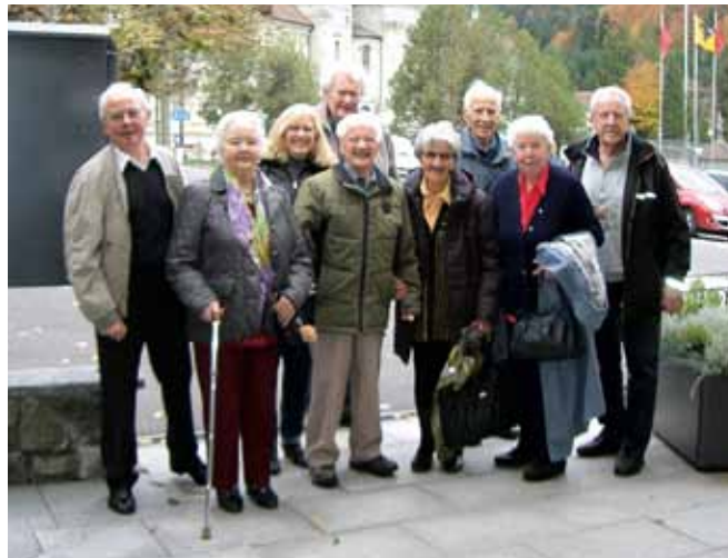
Die Ausflügler in Einsiedeln.

Von den 17 Senioren, die 80 und älter sind, haben sieben teilgenommen. Mit einem Kleinbus wurden die Teilnehmer am Morgen zu Hause abgeholt (ob es wohl die Vorfreude war, dass alle so pünktlich bereit standen?) Der „Abhol-service“ ging von Kollbrunn übers Zürcher Oberland bis in die Stadt Zürich und weiter nach Bonstetten, wo auch das letzte Mitglied abgeholt wurde. In Bonstetten machten wir dann auch einen Kaffeehalt. Frisch gestärkt, fröhlich und