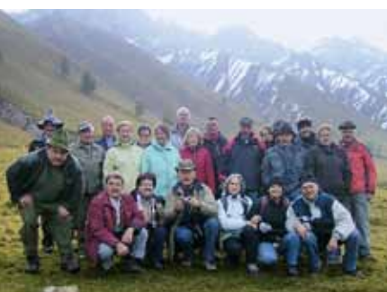
Die Wanderung im Nationalpark könnte zur Tradition werden.