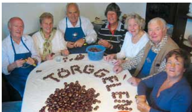
Das Ritzen der Kastanien

Ankündigung: Am Samstag, den 21. Januar 2012 findet im Park Plaza Victoria Hotel in London das „Südsterne“-Südtirolertreffen 2012 statt.