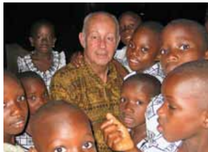
Helmut Kutin in Togo.

Kutin: „Stolz hob i nie ghobt“, aber ich bin dankbar! In meiner Zeit als Präsident sind über 280 SOS-Kinderdörfer entstanden. Ich bin dankbar, dass wir nach 1989 in Osteuropa und in Zentralasien tätig werden konnten. Alle Nachfolgestaaten der Udssr haben die SOS-Kinderdörfer willkommen geheißen. Wir arbeiten dort sehr erfolgreich für Kinder die früher in staatlichen Waisenhäusern untergebracht waren. Noch dankbarer bin ich, dass wir Menschen und Kindern in Afrikas Krisenregionen helfen konnten und können.