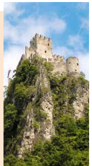
Die hochmittelalterliche Burgruine Haderburg oberhalb von Salurn.