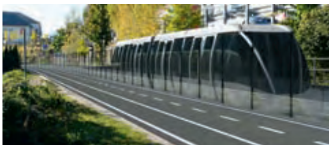
Modell einer möglichen Bahn ins Überetsch.

Die Minimetro sollte Kaltern über Eppan, St. Pauls und Sigmundskron mit Bozen verbinden, wobei an eine Weiterführung im Stadtgebiet bis zum Verdiplatz und zur Talstation der Seilbahn auf den Ritten gedacht wurde. Die Gesamtkosten werden auf 200 Millionen Euro geschätzt.