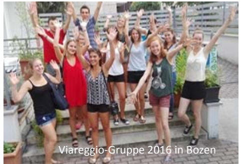
Viareggio-Gruppe 2016 in Bozen

Der sonnenverwöhnte Strand von Viareggio an der toskanischen Riviera ist der ideale Ort, den Italienisch-Sprachkurs mit einem Meerurlaub in Italien zu verbinden. Die jungen Südtiroler haben die Möglichkeit, für zwei oder drei Wochen an die toskanische Riviera zu ziehen, und dort in der Schule „Centro Giacomo Puccini“ zusammen mit weiteren SprachstudentInnen die Italienische Sprache zu erlernen. Das erste Treffen wird am Samstag, 29. Juli 2017 in BOZEN/Südtirol stattfinden. Nach einem ersten Kennenlernen der TeilnehmerInnen und einem gemeinsamen Abend-bzw. Pizzaessen , zusammen mit Vorstandsmitgliedern der „Südtiroler in der Welt“ und einer Mitarbeiterin der Arbeitsstelle, können alle den Tag gemütlich in der Landeshauptstadt, mit inbegriffener Übernachtung in einer Jugendherberge, ausklingen lassen. Am Sonntag, 30. Juli 2017 fahren die TeilnehmerInnen nach dem Frühstück mit dem von der Arbeitsstelle organisierten Bus nach Viareggio, zuerst zur Schule und dann zu den jeweiligen Unterkünften und Gastfamilien. Am Montag, 31. Juli 2017 beginnt der Sprachunterricht im Centro Puccini.